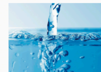
Acqua alcalina ionizzata