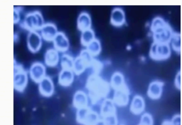
Fluidità del sangue